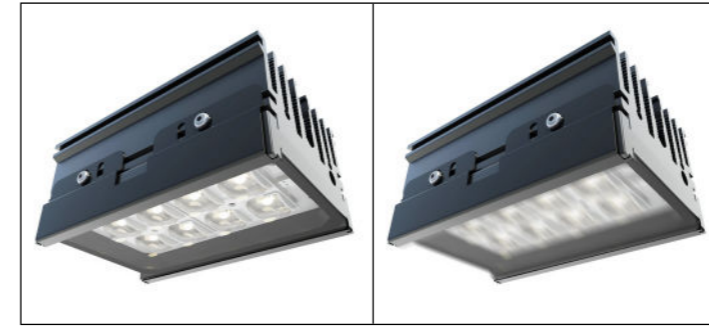
Coupe flux / Flow cut