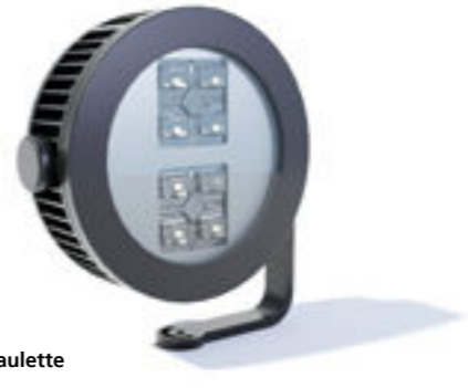
Modèle / model: Paulette XL routier / street