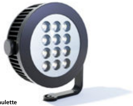
Modèle / model: Paulette XL Architectural